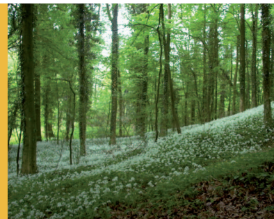
Bärlauchteppich im Frühjahr