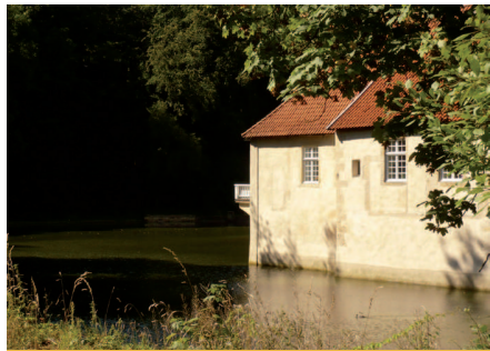
Wasserschloss Haus Marck

Am Fuß der Stadt Tecklenburg liegt das Naturschutzgebiet „Talaue Haus Marck“. Hier treffen Sand- und Kalkzüge des Teutoburger Waldes auf feuchte Auen des Wechter Mühlenbaches. So finden sich auf engstem Raum stark wechselnde Lebensbedingungen. Nicht nur für die heimische Tier- und Pflanzenwelt ist das Gebiet reizvoll. Auch für Besucher bietet die naturnahe Umgebung viel Schönes zu entdecken.