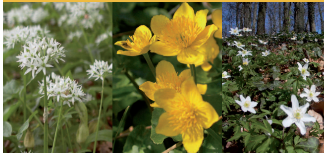
v. l.: Bärlauch, Sumpfdotterblume und Buschwindröschen