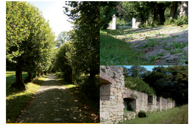
Rund um das Wasserschloss

In der Talaue laden alte Wirtschaftswege zum Spaziergehen ein. Teilweise werden diese schon seit der Zeit des Westfälischen Friedens als Transport- und Handelswege genutzt. Nach und nach haben sie sich tiefer ins Gelände eingeschnitten. Diese sogenannten Hohlwege findet man nördlich des Wasserschlosses.