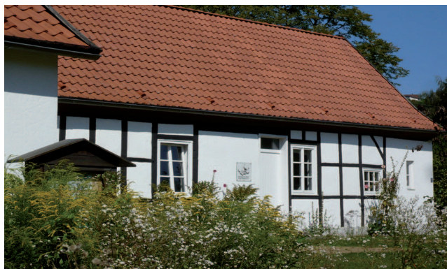
Biologische Station Kreis Steinfurt

Um die Talaue für die Zukunft zu erhalten, steht das Gebiet seit März 2009 unter Naturschutz. Wir bitten Sie daher, auf den ausgewiesenen Wegen zu bleiben und auch keine Pflanzen zu entnehmen. So tragen Sie dazu bei, dass sich die hier lebenden Tiere und Pflanzen weiterhin wohl fühlen.